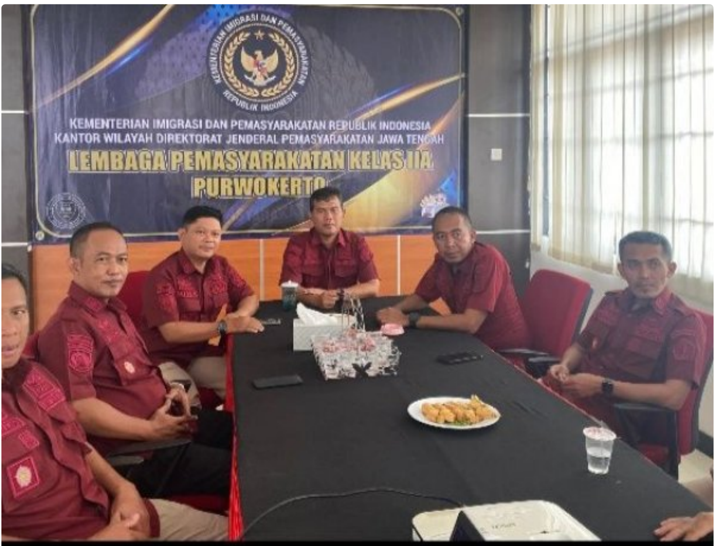
Lapas Purwokerto Ikuti Penguatan Kehumasan terkait Etika Penggunaan Media Sosial

PURWOKERTO Lembaga Pemasyarakatan (Lapas) Kelas IIA Purwokerto Mengikuti Secara Virtual Penguatan Kehumasan terkait Etika Penggunaan Media Sosial bagi ASN Pemasyarakatan, pada Kamis (06/02/2025).